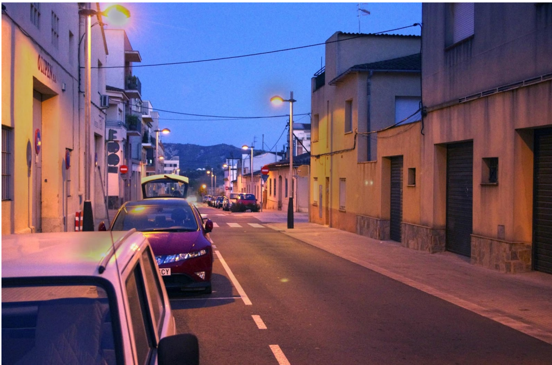
CARRER MARE RAFOLS – JULIOL 2012