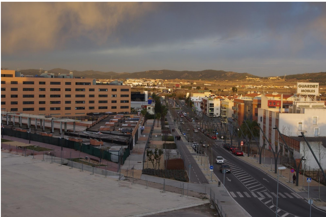
AVINGUDA BARCELONA - JULIOL 2012