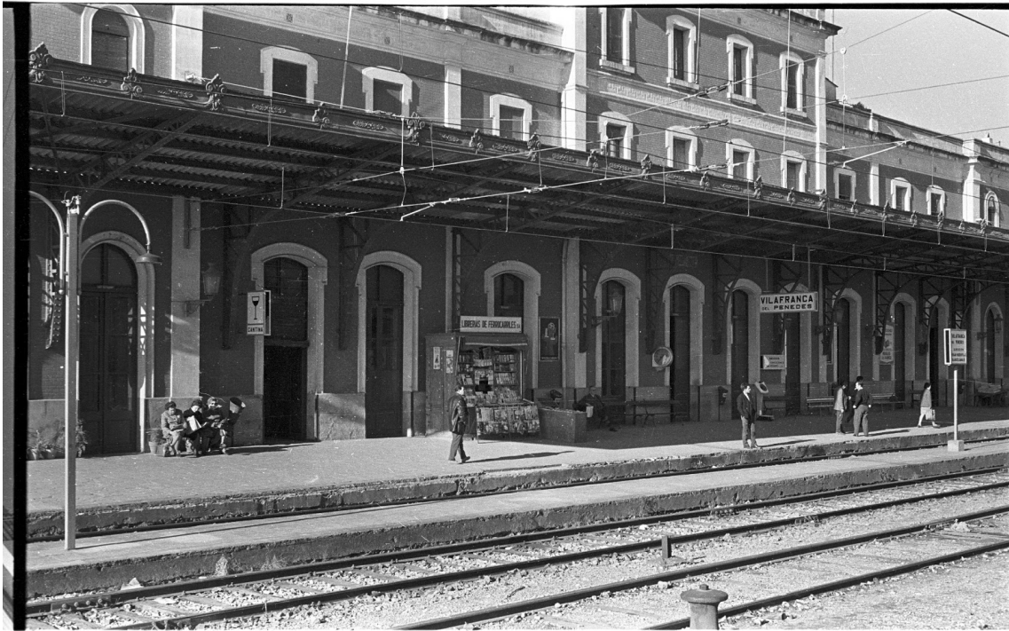
ESTACIÓ - 1972