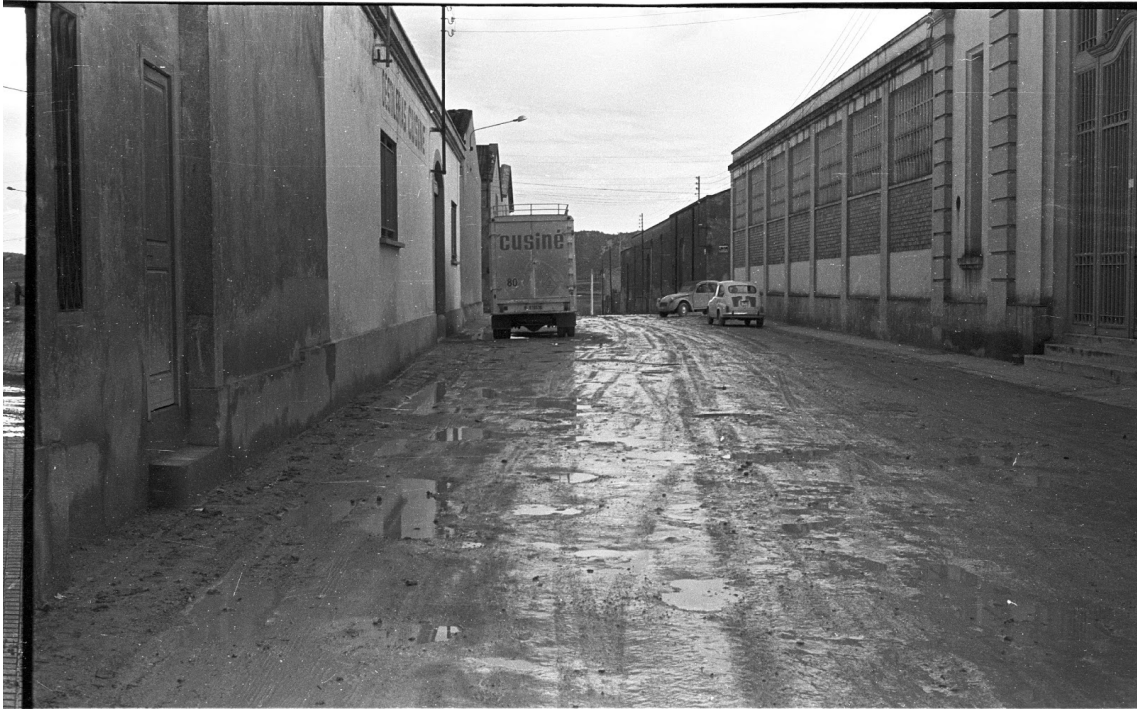
CARRER MARE RAFOLS - 1972