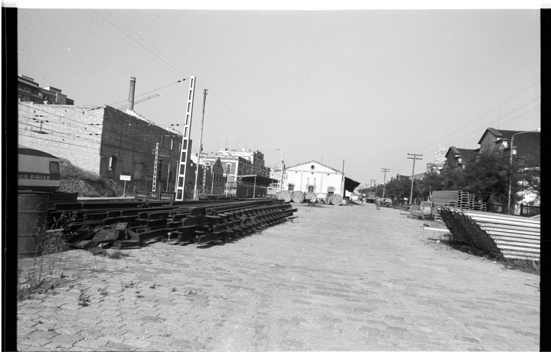
ESPLANADA DE L'ESTACIÓ - 1979