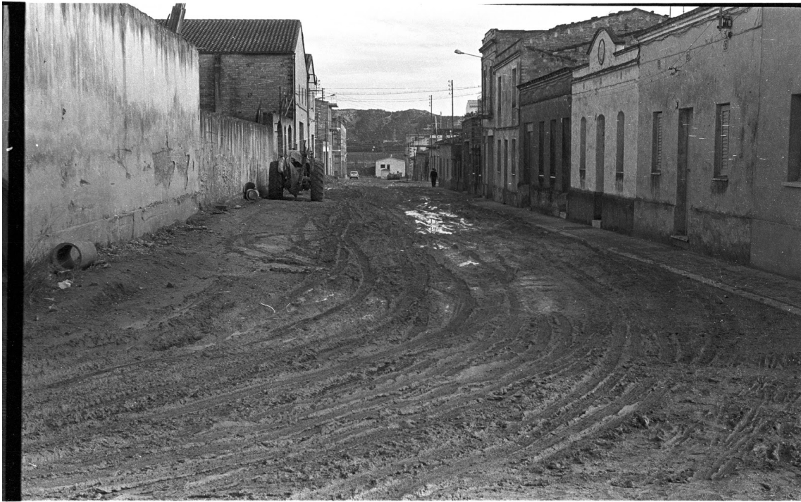
CARRER MARE RAFOLS – 1972