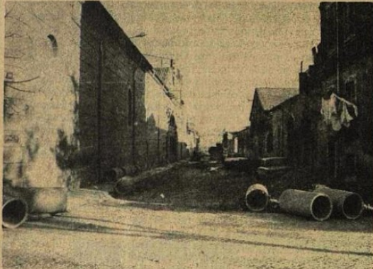
Calle Doctor Jané