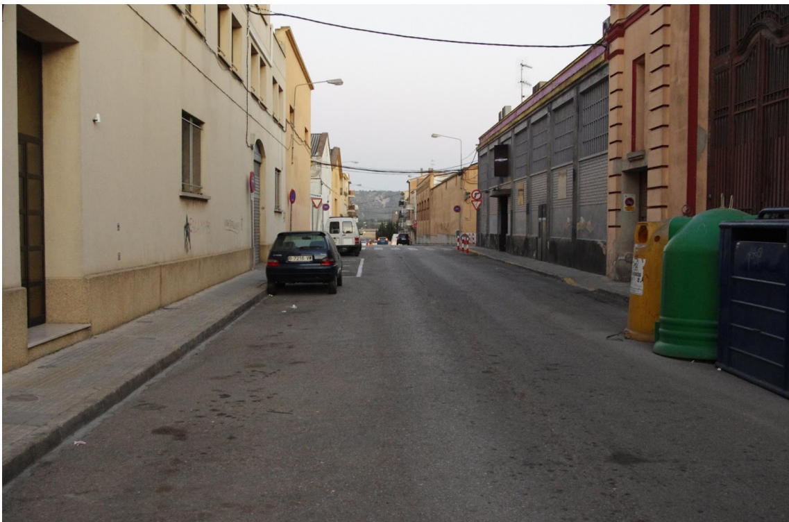
CARRER MARE RAFOLS - JULIOL 2012