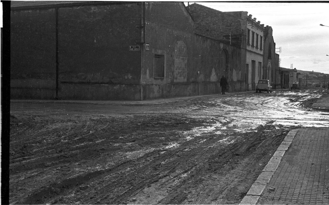
CARRER SARRIERA - 1972