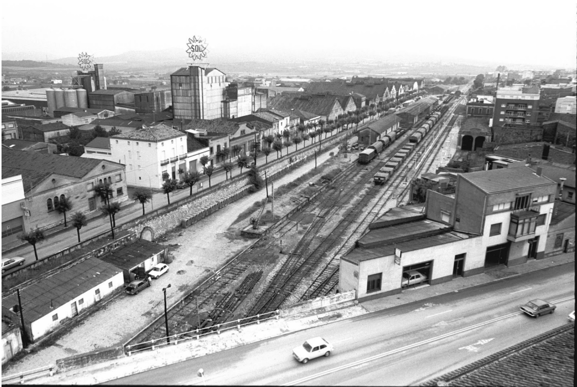
PANORAMICA DE L'ESTACIÓ - 1972