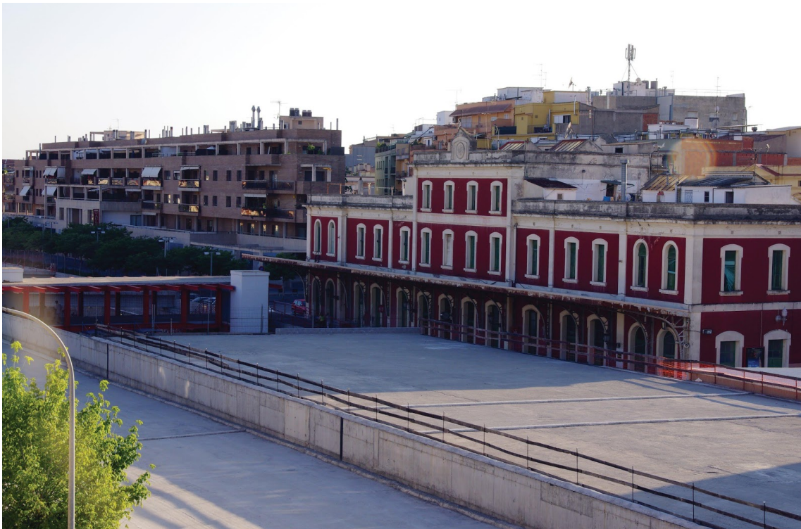
ESTACIÓ - JULIOL 2012