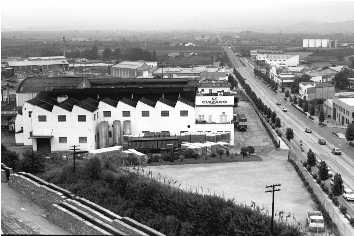
CINZANO - 1981