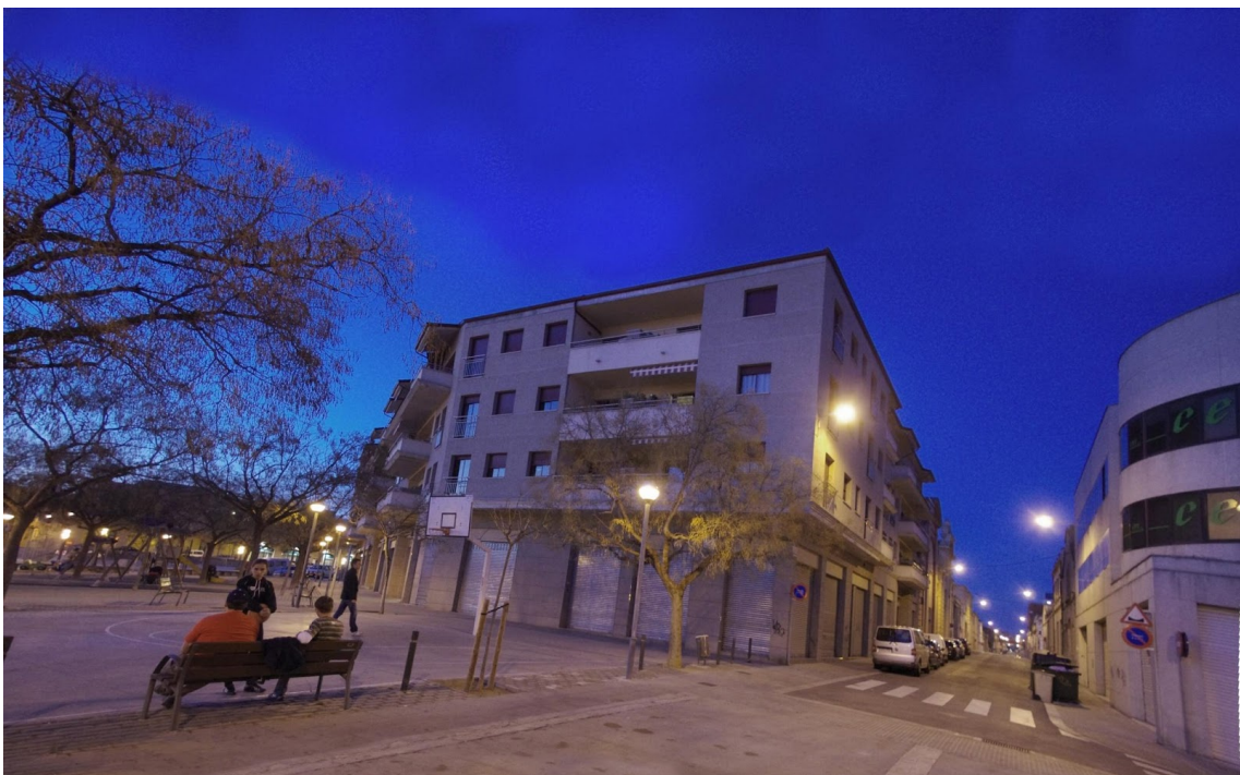
PLAÇA VILANOVA - JULIOL 2012