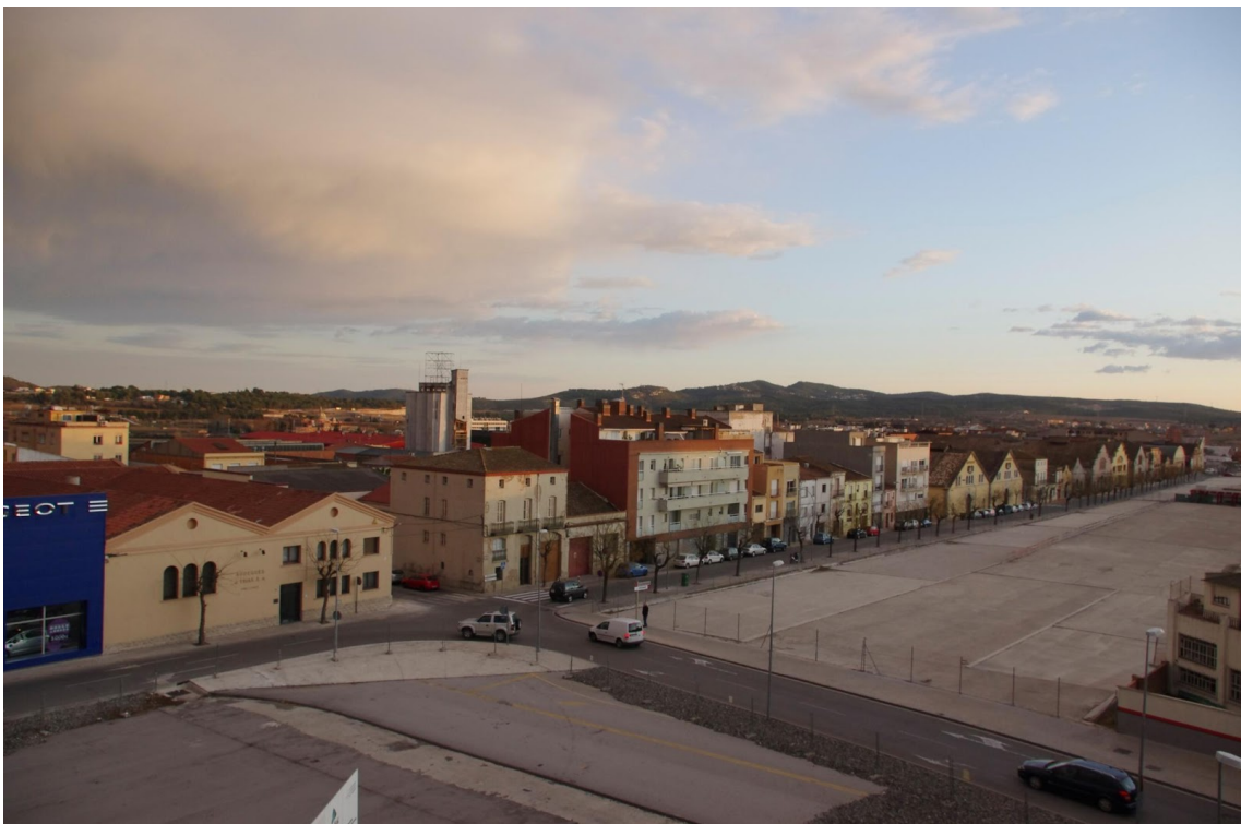
CARRER COMERÇ - JULIOL 2012