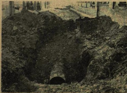
Calle de Sarriera.