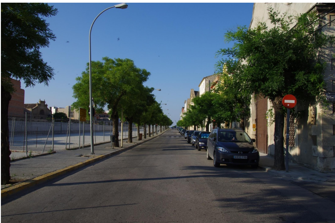
CARRER COMERÇ – JULIOL 2012