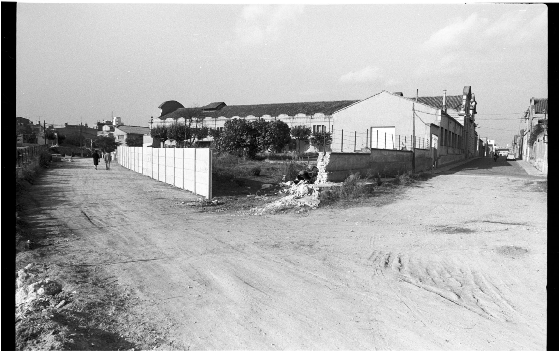
PLAÇA VILANOVA - 1978