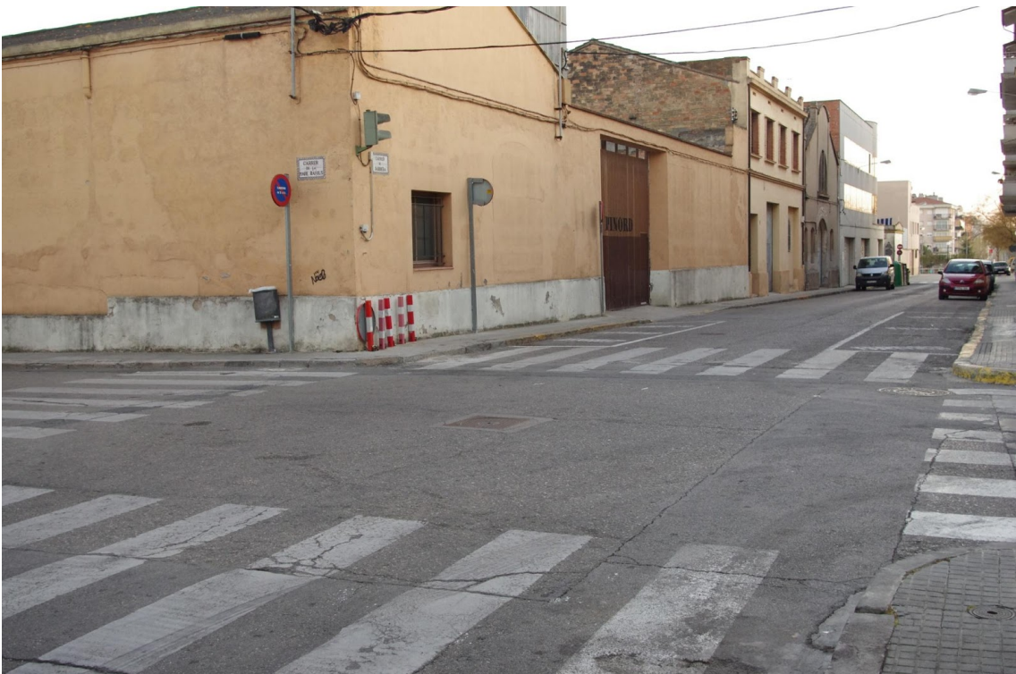
CARRER SARRIERA - JULIOL 2012