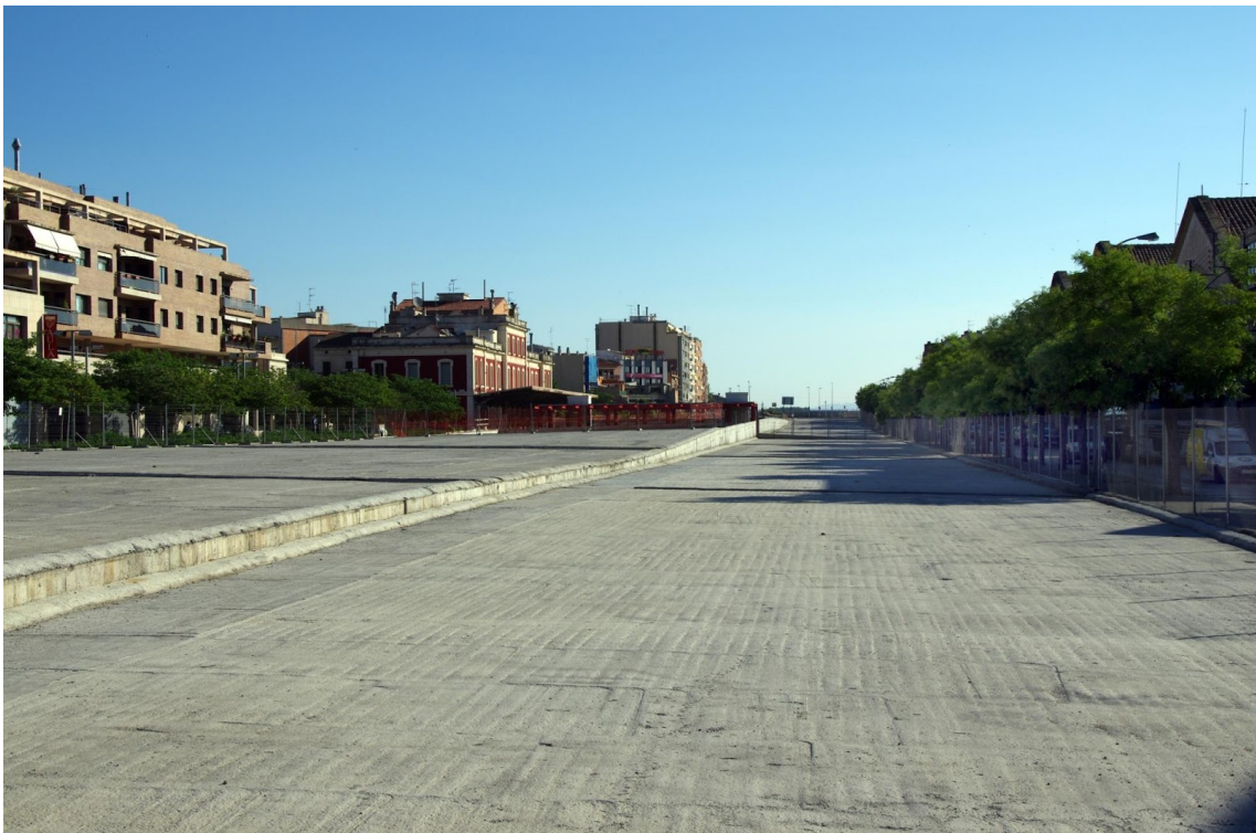
LLOSA DE L'AVE - JULIOL 2012