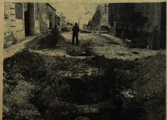
Calle de Sarriera.

La Arago tra el de las rucció Barrio de un Escuela