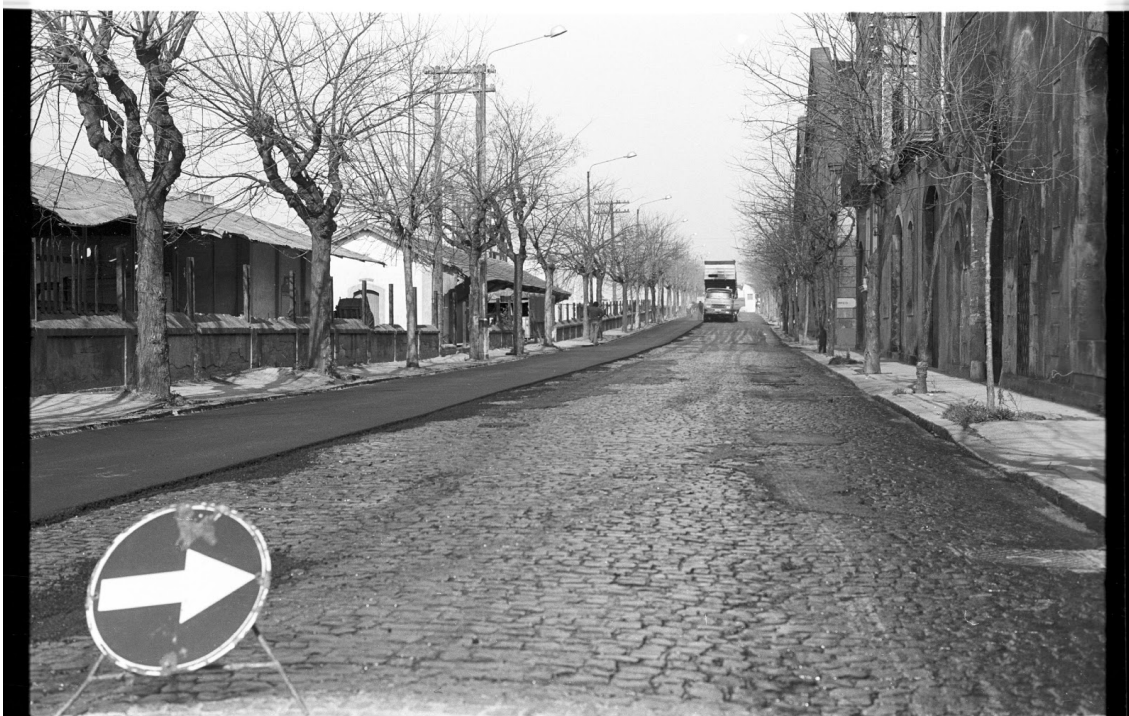
ASFALTAT CARRER COMERÇ – 1979